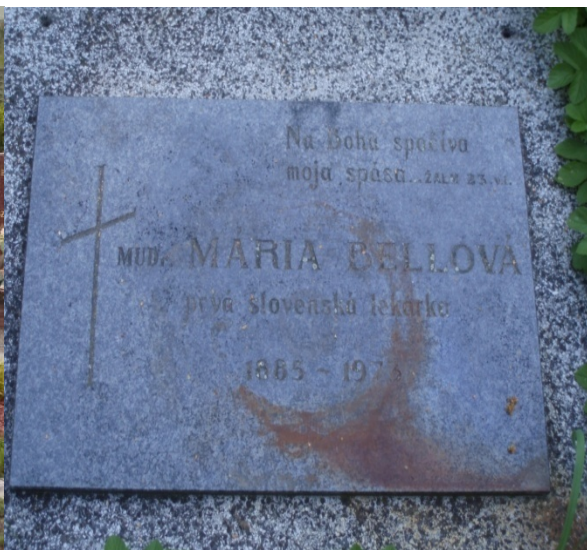
Náhrobok Márie Bellovej Na Martinskom národnom cintoríne.