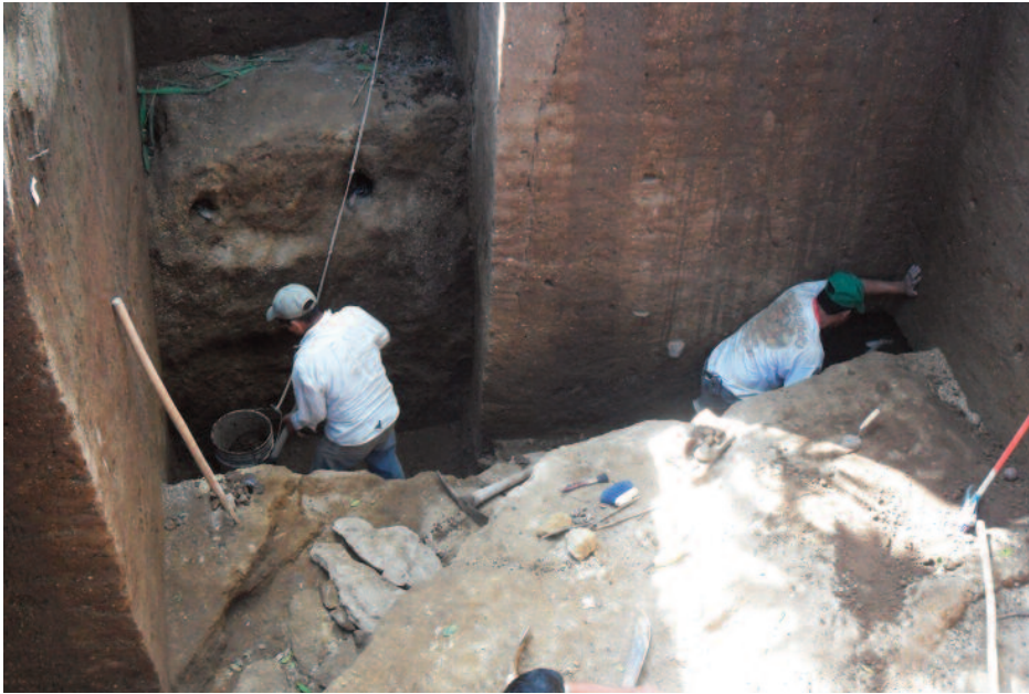
Figura 1. Excavación de los canales.