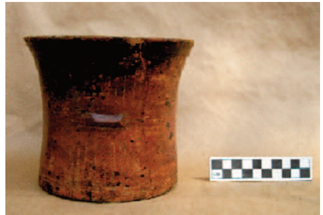
Figura 2. Vaso Café Negro.

El sector pasó de ser un área de actividad especializada a una de carácter meramente habitacional y domés-