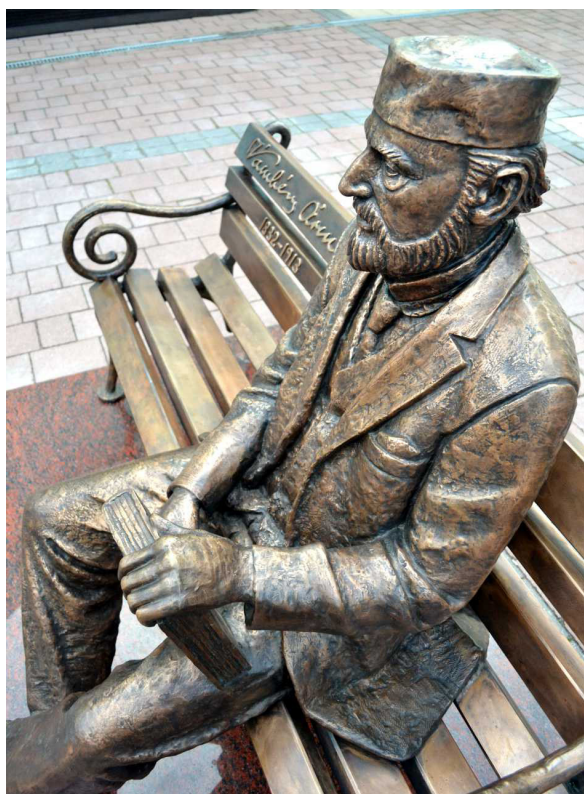
Obrázok 2: Socha Vámbéryho sediaceho na lavičke v Dunajskej stredě, odhalená v r. 2018.

niektorých dunajskostredských občanov a v r. 2000 založili Občianske združenie Ármína Vámbéryho (Vámbéry Polgári Társulás. n.d.). Z ich iniciatívy sa konávajú Vámbéryho dni v Dunajskej Stredě, kde učencovo meno nesie aj hlavné námestie a jedna zo škôl (Vámbéry Ármín Gimnázium n.d.). Občianske združenie od r. 2001 organizuje aj celoslovenskú zemepisnú súťaž pre žiakov základných škôl s vyučovacím jazykom maďarským pomenovanú po slávnom cestovateľovi. Vámbérymu sú v meste venované dve sochy - busta odhalená v r. 2001 sa nachádza na námestí s jeho menom a v r. 2018 pribudla v centre Dunajskej Stredě socha v životnej veľkosti – Vámbéry sediaci na lavičke.