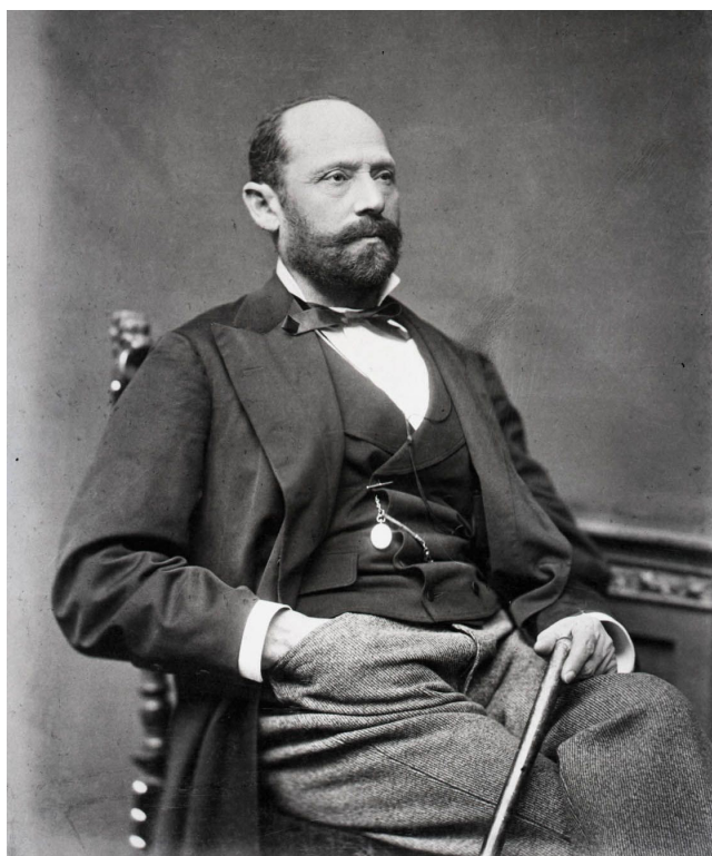
Obrázok 1: Fotografia Ármina Vámbéryho ako univerzitného profesora z r. 1876.