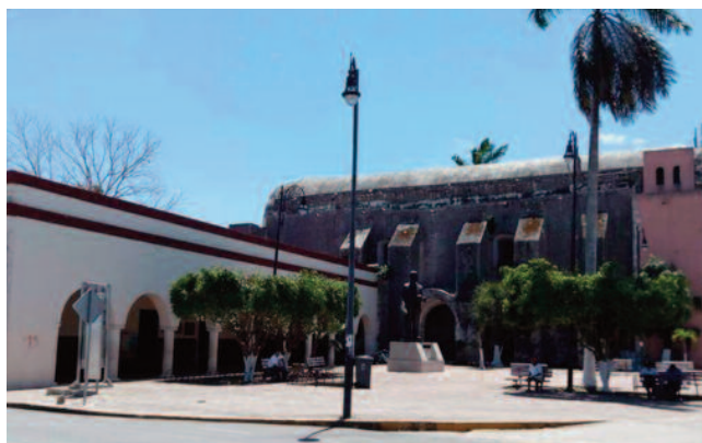
Obrázok 2. Kostol a kasárne v kultovom rituálnom centre Hnutia hovoriacich krížov Chan Santa Cruz (Autor Jesús Caamal).

Yucatánski Mayovia sa snažili znovu ustanoviť spoločné vlastníctvo pozemkov, model, ktorý sa osvedčil v minulých etapách kolonializmu a takisto pred príchodom Európanov. V neposlednom rade treba spomenúť dlhodobé fyzické zneužívanie Indiánov zo strany bielych a mesticov napr. formou neprimeranej práce. S tým súviselo aj právo na plnosť občianskych práv, ktoré boli udelené prakticky len bielym a mesticom (González Navarro 1988: 573-574). Dlhodobá nespokojnosť domorodých Yucatáncov so socio-politickými podmienkami a snaha o dištancovanie sa od autokratického modelu vládnucej vrstvy v Mexiku, priviedla Mayov k nutnosti rázneho riešenia, ktoré by radikálnym spôsobom reorganizovalo sociálnu realitu polostrova.