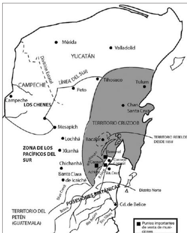
Obrázok 4. Územie polostrova Yucatán ovládané bojovníkmi hovoriacimi krížov v rokoch 1849 – 1863 (Sweeney 2008).