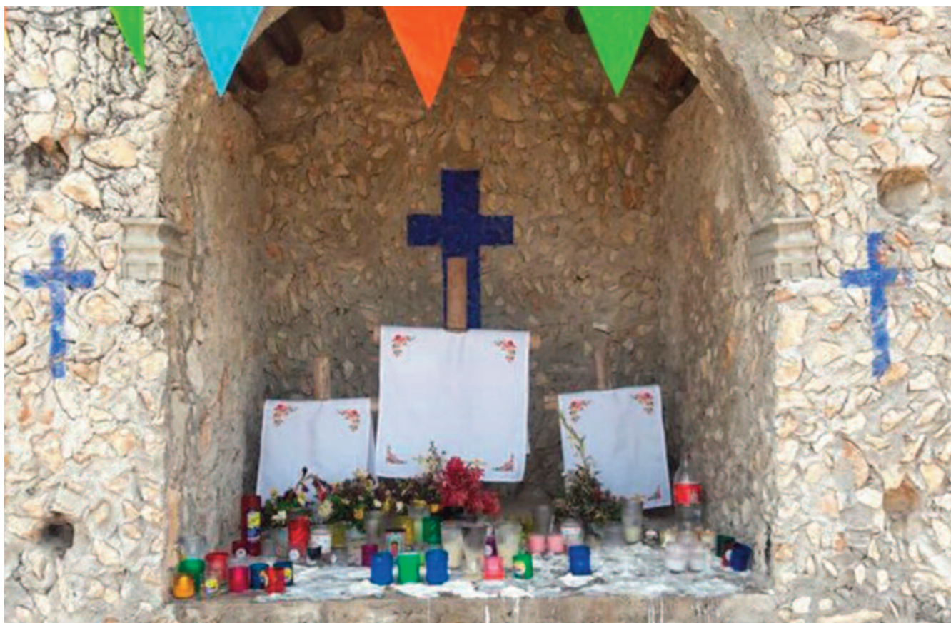
Obrázok 6. Symbolická svätyňa trojice svätých krížov v meste Felipe Carrillo Puerto, Quintana Roo, Mexiko (pôvodne Chan Santa Cruz).

vyhlásená v roku 1975 (hlavne články 1, 2 a 4 prvej kapitoly) (Obrázok 6):