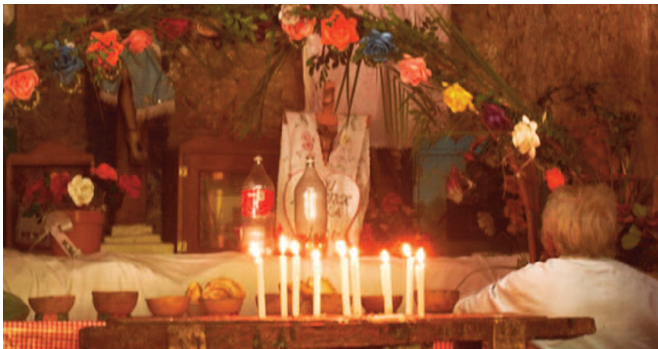
Obrázok 3. Kult okolo svätých hovoriacich krížov

nia, samozrejme, nie sú dokázateľné a išlo skôr o pokus o zaradenie neznámych národov do európskeho historického rámca.