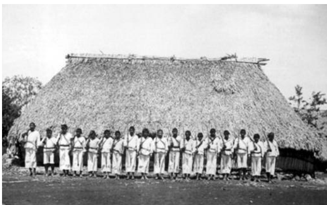
Obrázok 1. Mayskí bojovníci „los crucoob“ v tradičných odevoch (Verdayes Ortiz 2019).