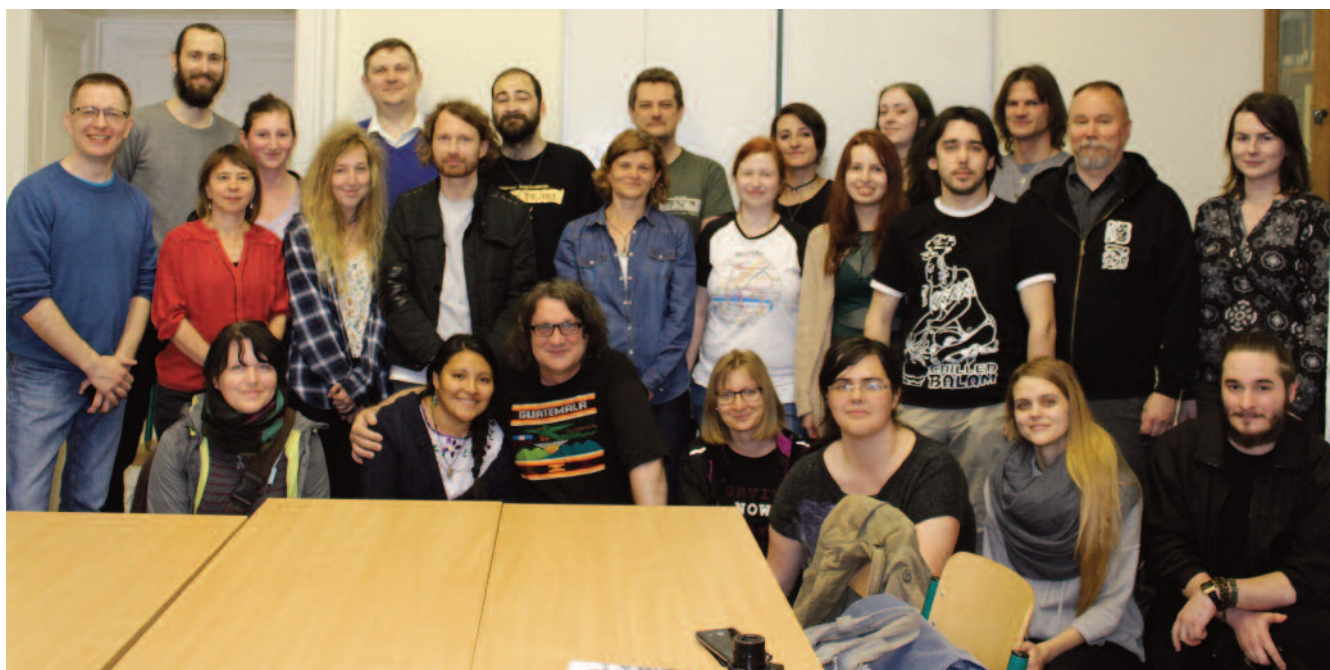
Účastníci konferencie Maya Meeting 2019