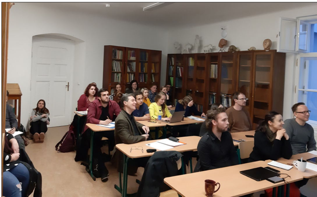
Obr. 1. Diskusia počas vedeckého kolokvia v archeologickom seminári.

Na kolokviu prezentované výskumy boli vo väčšine súčasťou projektov podporených Vedeckou grantovou agentúrou MŠVVaŠ SR (VEGA), Agentúrou na podporu výskumu a vývoja (APVV) a z dotácií Špičkového tímu AMOS. 1 Sedem prednášajúcich predstavilo výsledky svojich domácich a medzinárodných výskumných aktivít, ktoré diskusnými komentármi a samostatnými vstupmi doplnili spolupracovníci z iných pracovísk prítomných v pléne (PriF UK v Bratislave, ČVUT v Prahe). Po prekonaní počiatočného ostychu sa do diskusií zapojili aj študenti a vecne obohatili jednanie kolokvia.