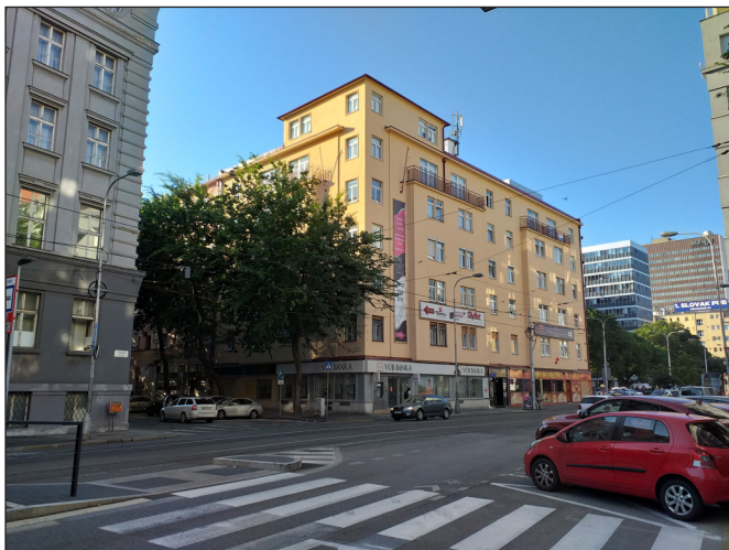
Obr. 1. Machotov dom na Špitálskej ulici. Bývalé sídlo Archeologického seminára.