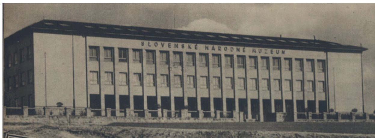
Obr. 2. Budova Slovenského národného múzea v Turčianskom Sv. Martine. Od roku 1939 bola zároveň sídlom Štátneho archeologického ústavu. Nový svet , 31. máj 1941.