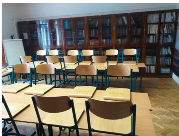
Obr. 1. V učebni G328 neprebíhala počas zimného semestra prezenčná výučba. Namiesto toho poslúžila niektorými pedagógom ako vhodné prostredie pre dištančnú výučbu.